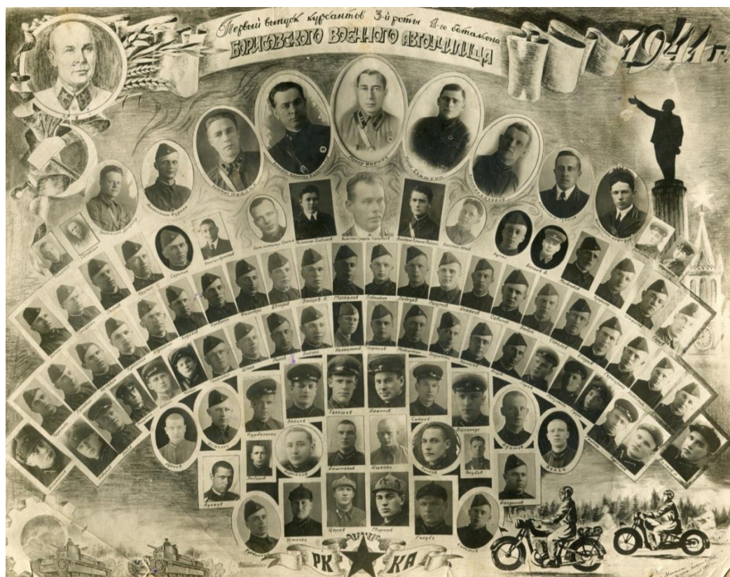
Первый выпуск курсантов 3 роты 1 батальона Борисовского военного училища. Отец во втором в нижнем ряду, третий справа.

Вскоре училище переехало в город Гомель, а с началом войны – в Гороховецкие лагеря под Горьким. В конце 1941 года и начале 1942 года отец просит командировать его в действующую Армию. В июне 1942 года в связи с переходом училища на танковой профиль просьба была удовлетворена. Был откомандирован в Действующую Армию и направлен в качестве адъютанта в 68 отдельный мотоциклетный батальон 2 механизированного корпуса.