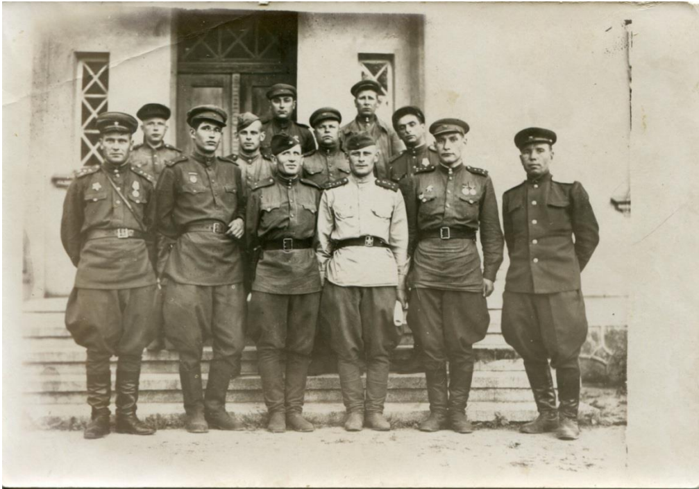
Фотография 1945г. Отец стоит внизу второй справа

Отец находился за границей в Польше Германии в составе 1 Белорусского фронта 58 Отдельного Лодзинского полка с августа 1944 года по сентябрь 1945 года. Во время Великой Отечественной войны отец принимал участие в боевых действиях, как на территории Польши, так и