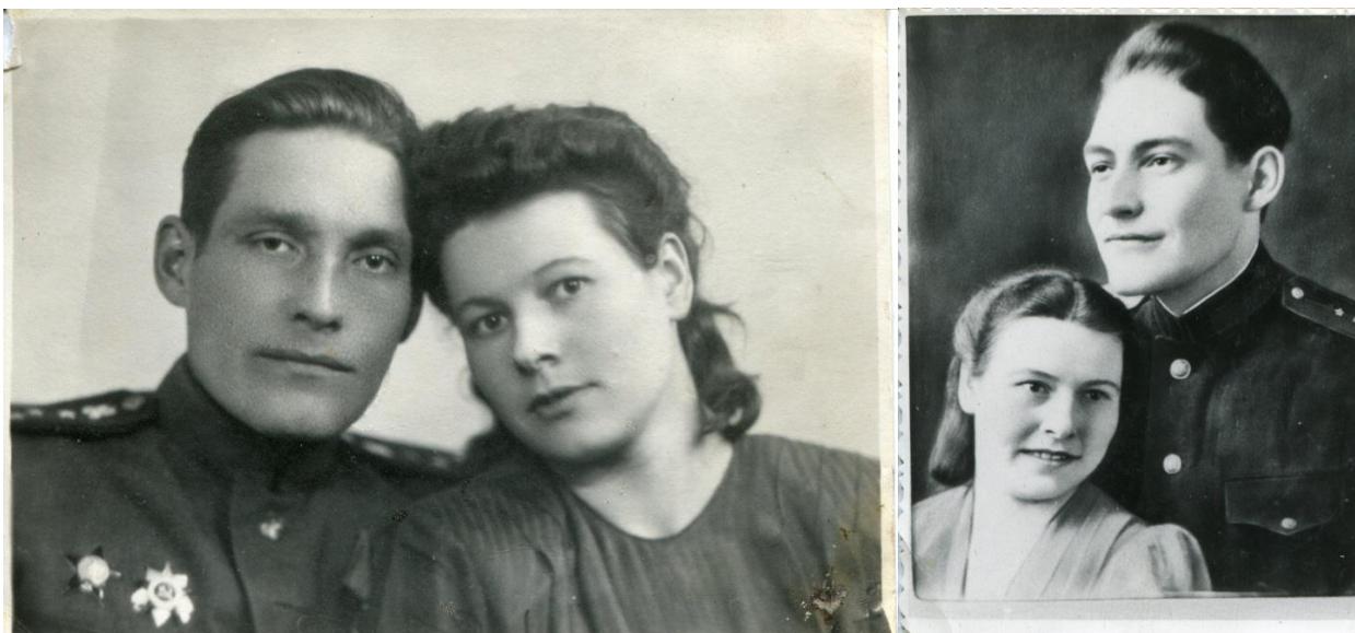
Фотографии моих родителей.