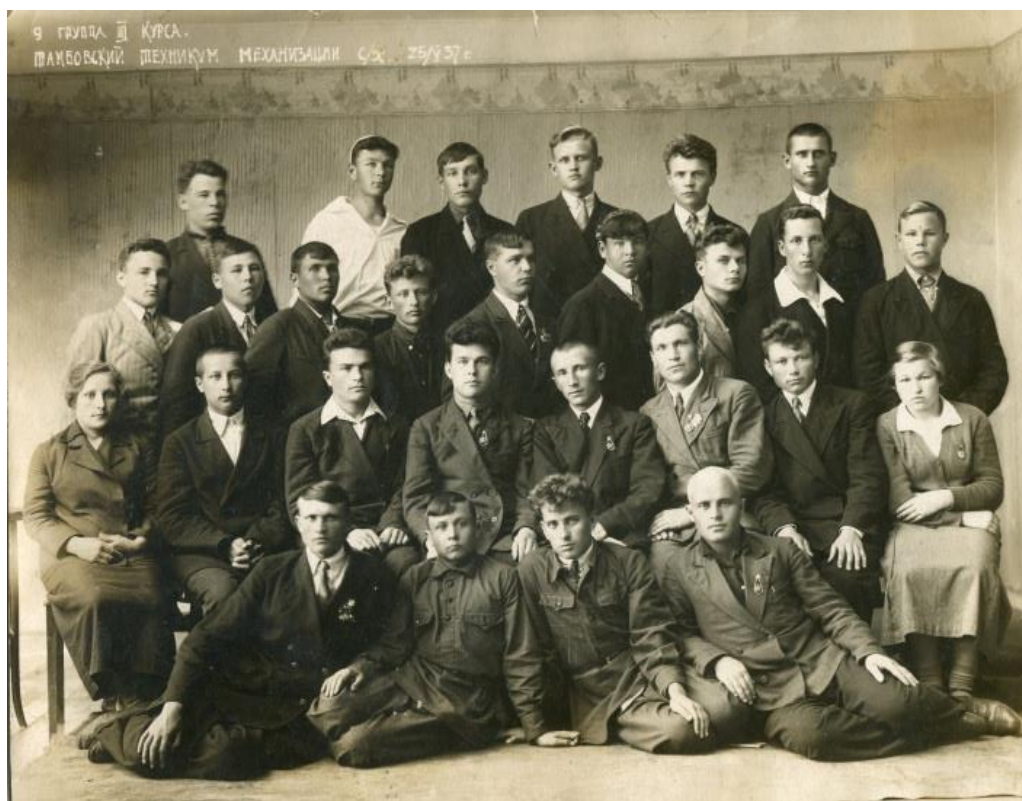
Тамбовский техникум механизации с/х 9 группа 3 курс.