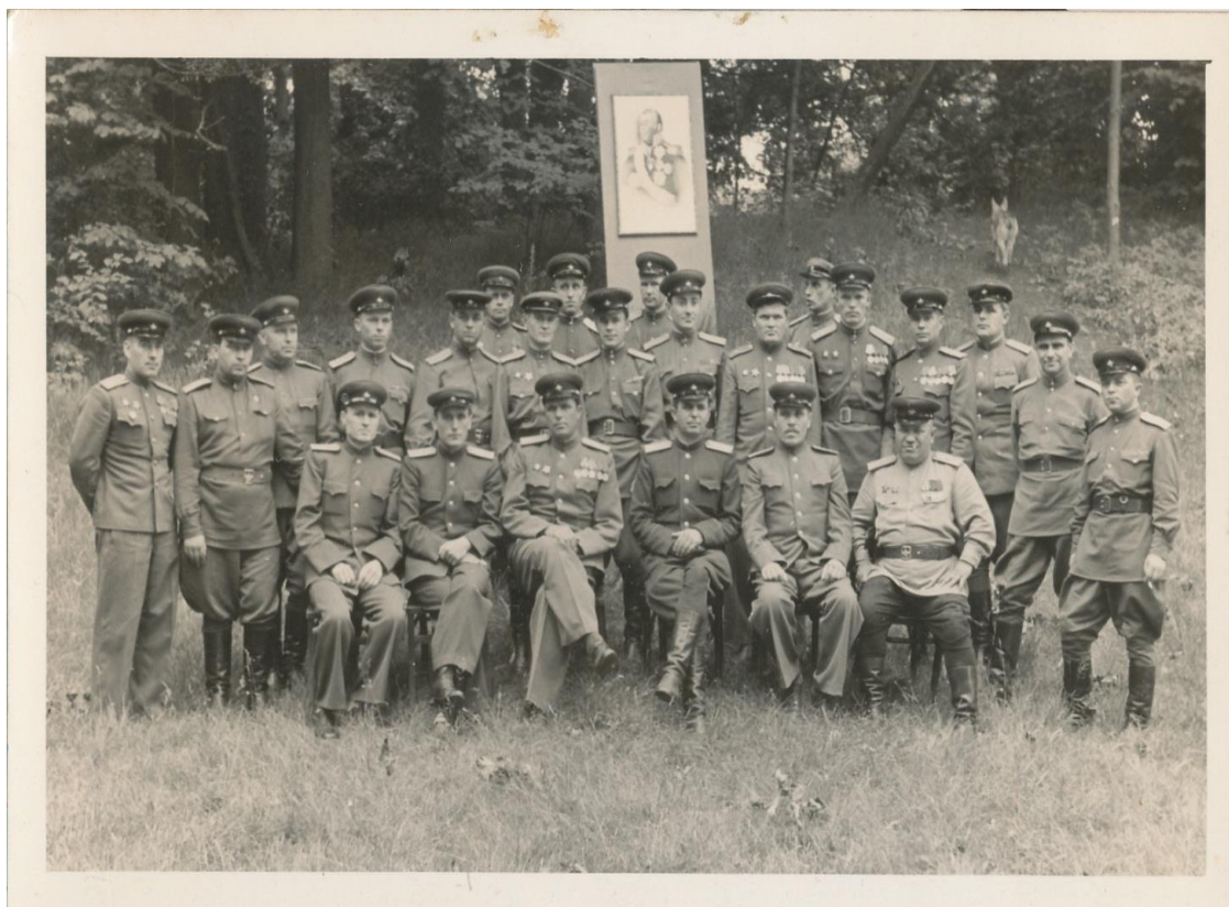
Командный состав 18 автомобильной бригады в день вручения Ордена Кутузова 2 – й степени. 1944 год. Отец 2 – й слева в первом ряду.

Германии. В составе 58 отдельного Лодзинского автомобильного полка 18 Барановичской Красного Знамени и Кутузова 2 степени бригады 1 Белорусского фронта принимал участие в освобождении Варшавы, Лодзи, дошёл до Берлина. Отец воевал до Победы. Начинал на Калининском фронте, воевал на Центральном, Украинском и Белорусских фронтах.